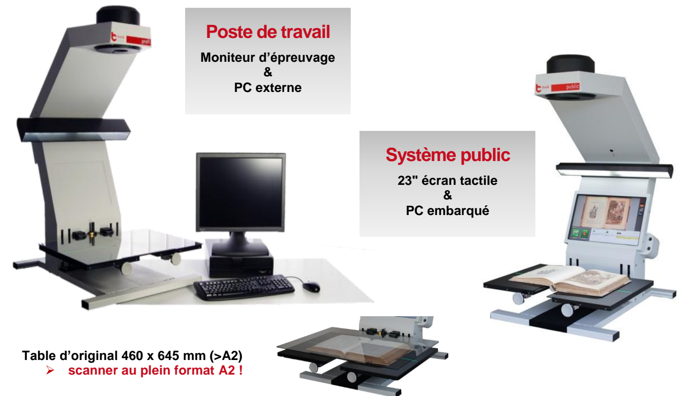
Table d'original 460 x 645 mm (>A2) ➤ scanner au plein format A2 !

Plaque Makrolon® variable et amovible ➤ scanner avec ou sans pression !