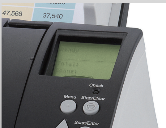
Écran à cristaux liquides intégré dans le panneau de commande

Les scanners fi-7180, fi-7280, fi-7160 et fi-7260 comprennent des fonctions d'administration centralisée que les administrateurs de système peuvent utiliser pour gérer l'installation et l'exploitation de plusieurs scanners, pour contrôler leur état de fonctionnement et pour mettre à jour les pilotes et logiciels à partir d'un seul emplacement. Cette fonctionnalité réduit considérablement le coût et le travail d'installation, d'exploitation et de maintenance des nombreux scanners utilisés dans une organisation et cela permet aussi d'élargir le réseau de scanners dans plusieurs emplacements.